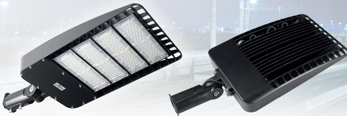
PSL 04 250w